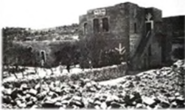
ישיבת כנסת ישראל בעיר חברון

הישיבה הראשונה שהוקמה בארץ הקודש ביישוב החדש היתה ישיבת כנסת ישראל סלבודקה שפתחה שלוחה בחברון (בשנת תרפד-ה) ולאחר מכן בירושלים. ע"י הקמת ישיבה זו פרץ לימוד התורה גם אל מחוץ לגבולות היישוב הישן שבירושלים. סגנון הישיבה הנותן דגש על זקיפות קומה והדר הן בפנימיות והן בחיצוניות, היה תריס חזק בפני הרוחות