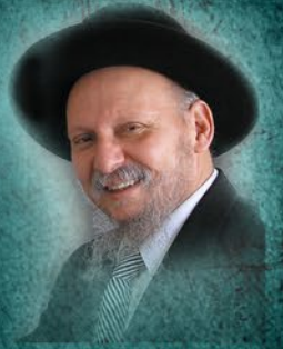
ר' תשרי תש"ז - כח' שבט תשע"ב