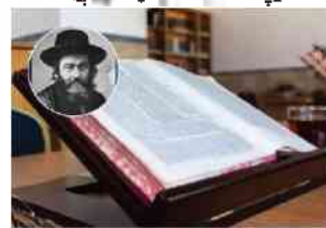
דמות דיוקנו של הג"ר מאיר שפירא זצ"ל מחולל הדף היומי

מקור נוסף לשמחה בגמר מצוה, כתוב בפסוק (מלכים א פרק ג פסוק טו) ניקץ שלמה והנה חלום, ויבוא ירושלים ויעמד