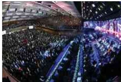
מעמד הראשון של סיום הש"ס מחזור י"ג על ידי ארגון 'דרשו' בניני האומה מוצש"ק מקץ ל' כסלו תשע"ט

עוד אומרים בשם הג"ר מוילנא שאילו היו יודעים בני אדם מעלת סעודת הסיום, היו מלקקים את הצלחת בסעודת הסיום. ומעלת הסיום מרומז בראשי תיבות של המלאך המקטרג סמ"ל, "סיום מסכת אין לעשות".