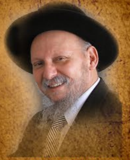
ר' חשרי תש"ז - כח' שבט תשע"ב