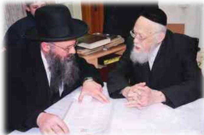
עם מרן עמוד ההוראה הגר"ש אלישיב זצ"ל

בתורה, בתפילה ובעבודת ה'. במלאכת מחשבת פותח צוער בליבם של בני הישיבה, ומבסס להם את "אבן השתייה" של בן עלייה. בדור תהפוכות, אשר גם בין