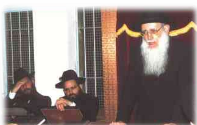
נשיא הישיבה הגר"א פלדמן שליט"א וחתנו רה"י שליט"א ביסוד הישיבה

המתקיים מידי שבוע ביום רביעי. בבוקרו של השיעור, מקבץ ראש הישיבה שליט"א סביבו את בני כל שיעור ושיעור לריתחא דאורייתא סביב השאלות עליהם מבוסס השיעור. כך גם לאחר השיעור, בני שיעור א' מתחלקים לחבורות קטנות, כשבראש כל חבורה עומד א' מבני הקיבוץ לחזור ולחדד את היסודות שנתייסדו בשיעור כללי.