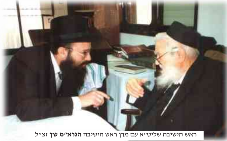
ראש הישיבה שליט"א עם מרן ראש הישיבה הגרא"מ שך זצ"ל