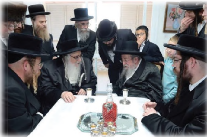
כ"ק מרן האדמו"ר מצאנז שליט"א בביקור בביתו

אפשר הרבה להאריך אבל הזמן כבר מאוחר. כמה הרבה קיבלנו מהרב זצ"ל. צריכים לדעת שכל מה שאנחנו רואים פה את הסדר בעיר, את מוסדות החינוך והמוסדות העירוניים, הכל מכוחו של הרב זצ"ל. כל מה שיש לנו פה בעיר כפוף לדעת תורה, הרי אין עיר כזו בעולם שכולם כפופים לדעת תורה. אף אחד לא מרים ידו ורגלו בעיר בלי הסכמה של דעת תורה. אין אירוע אחד שנעשה בעיר בלי הסכמה. אין מוסד חינוך שמתנהל שלא לפי דעת תורה. הכל הכל מכוחו של הרב זצ"ל. כל היש והקיים