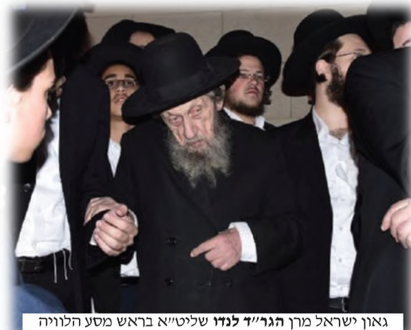
גאון ישראל מרן הגר"ד לנדז שליט"א בראש מסע הלוויה

כל מי שבא במגע עימו חש ביראת השמים הבוהרת בו, ובעוצם קדושתו וטהרת ליבו. לפני שנים אחדות הגיע לביתר נשיא מועצת חכמי התורה של תנועת ש"ס, מרן הגאון רבי שלום כהן שליט"א , ושמע את רבי דוד צבי מדבר בהלכות צניעות. הוא יצא מהתפעלות ואמר: "היזהרו בו, זהו אדם קדוש!".