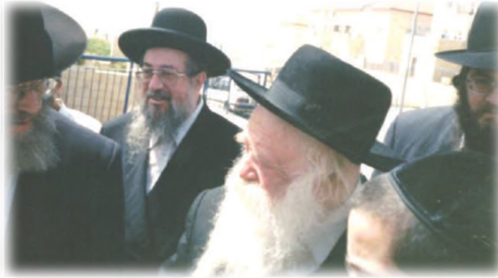
עם מרן שר התורה שליט"א בביקורו בעיר ביתר-עילית בשנותיה הראשונות

בעז"ה". חשבתי שהוא יוציא איזה ספר מתרמילו, או איזה קיצור הלכות קידושין, כדי לשנן את הלכות קידושין. אבל לא! הוא פשוט ישב בפינת האולם, לעיני עשרות אנשים, וחזר במוחו את כל הלכות קידושין בעל פה. אחרי עשרים וחמש דקות הוא קם, ניגש אלי ואמר: "כעת אני יכול להיות מסדר קידושין". איפה רואים היום דבר כזה?! כזו גדלות בתורה משולבת עם כזו יראת שמים עצומה.