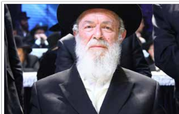
הגאון רבי יצחק זילברשטיין שליט"א

המשגיח הגה"צ רבי יחזקאל לוינשטיין כתב פעם לבחור בסוף ימי בין הזמנים של אב: "הנה הימים המאושרים משמשים ובאים"... הנביא אומה: "דרשו ה' בהימצאו, קראוהו בהיותו קרוב", הקב"ה קרוב אלינו, הוא נמצא כאן ועכשיו, הפסוק הזה מכיל בקרבו אושר עצום. לחץ לא-חיובי מקשה על בן תורה להבין את השמחה הזו. חבל, חבל שאין הם מרגישים את התחושה הנפלאה הזו, שהמלך הגדול, מלך מלכי המלכים, שבידו כל המפתחות לכל הבקשות והרצונות, המלך הזה שהוא גם אבא שלנו – נמצא עתה הרבה יותר קרוב אלינו, ויש בידנו אפשרות לבקש כל מה שנרצה. בשל קרבתו היקרה בימים אלה הוא גם ימלא בקלות רבה יותר את