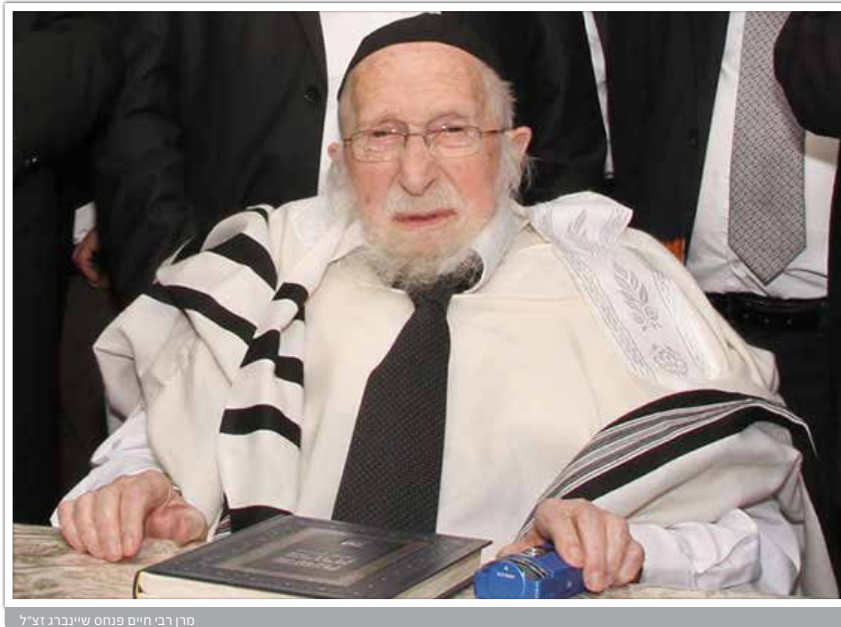
מרן רבי חיים פנחס שיינברג זצ"ל

את תפילות יום הכיפורים לא ישכחו התלמידים לעולם. מראהו, בעת שהסתובב עם ספרי התורה לאחר תפילת כל נדרי,