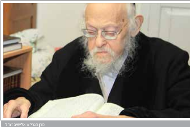
מרן הגרי"ש אלישיב זצ"ל

שנינו במסכת סוטה (יג): "לא אוכל עוד לצאת ולבוא", מאי לצאת ולבוא, אילמא לצאת ולבוא ממש, והכתיב "ומשה בן מאה ועשרים שנה במותו לא נס ליחה", (פרש"י: לא ברח לחלוחית כחו), וכתיב "ויעל משה מערבות מואב אל הר נבו", ותניא שתים עשרה מעלות היו שם, ופסען משה בפסיעה אחת. (רואים אנו שכחו היה במתניו). א"ר שמואל בר נחמני א"ר יונתן: לצאת ולבוא - בדברי תורה, מלמד שנסתתמו ממנו שערי חכמה. סיפר הגרי"ש אלישיב