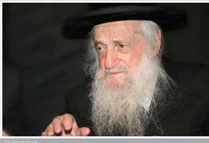
מרן בעל שבט הלוי זצ"ל

"חזק ואמץ כי אתה תבוא את העם הזה" (דברים ל"א, ז)