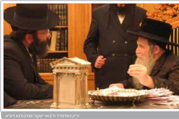
כ"ק האדמו"ר ה"באר יעקב" מנדבורנא זיע"א

[אביהם של ישראל - כ"ק האדמו"ר ה"באר יעקב" מנדבורנא זיע"א]