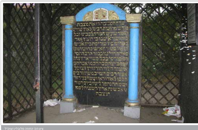
ציון הק' החווה מלובלין זצוק"ל

מסופר על תלמידו של ה"חווה מלובלין" שערך את ליל הסדר ברוממות הרוח ובכוונות נשגבות ונשאר ער עד לשחר, והמשיך בשפע האורות את סדר התפילות וכך עד לצהרי יום הפסח, לאחר מכן נתנמנם מעט כדי שיהיו לו כוחות לעריכת ליל סדר שני של גלויות אך נתאחרתו וקם ממש קודם חצות הלילה ומיהר לקיים את סדר המצוות בחיפזון ללא כוונות, רק לבו נשבר