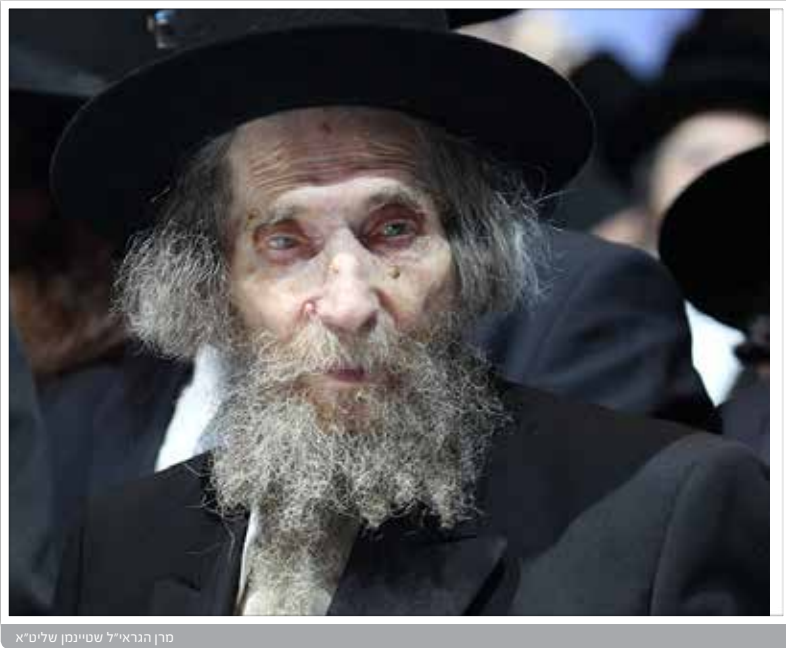
מרן הגראי"ל שטיינמן שליט"א

כשמרן הגראי"ל שטיינמן העביר 100 דולר לאדמו"ר מבעלזא זיע"א, ומה אמר מרן שליט"א כשעצרו בבין הזמנים ליד חוף הים