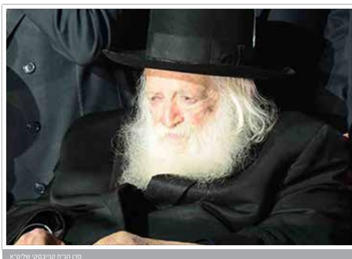
מרן הגר"ח קנייבסקי שליט"א

סיפר בן משפחה של הסטייפלר זצ"ל, שתמיד השתוקק לחטוף אתו איזה שיחה, לשמוע ממנו על שנות בחרותו, איך היה בנובהרדוק וכדומה. אבל אף פעם לא היה שייך לעשות זאת. תמיד למד. עד שמצא הזדמנות... הרעבעצין של הסטייפלר היתה מכינה את המאכלים ל"חזון אי"ש" [בהלוויה בקש הסטייפלר שיאמרו בהספד שזכתה לשמש