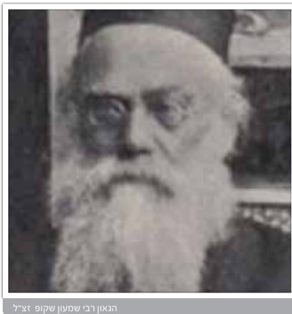
הגאון רבי שמעון שקופ זצ"ל

רבי שמעון שחשש מאד מהצעה זו, הסתפק האם ראוי הוא לאיצטלא כזו חשובה והאם יוכל לעמוד בה. מכל מקום, לאחר הפצרות רבות של דודו, ואחר שראה שיש כאן אות משמים, נעתר ונסע עם זוגתו לעיר טלז והתחיל ללמד בישיבה, ולא ארך זמן עד שאמר רבי שמעון: "כעת, אפילו