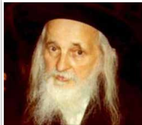
הגר"ר יואל מסאטמר זצ"ל