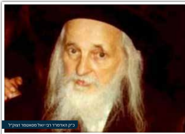
כ"ק האדמו"ר רבי יואל מסאטמר זצוק"ל

שאלה זו כבר נשאל מרן הגר"ח שמואלביץ זצוק"ל לאחר ימי המלחמה הנוראה. אני זוכר שהיו שחששו כי אין תקומה לעולם התורה, ומי יודע איך יקום דור חדש להחיות את התורה שהייתה קודם המלחמה בישיבות