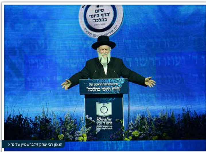
הגאון רבי יצחק זילברשטיין שליט"א

אם ננסה לתרגם את הדברים בלשונו, אמר הרב שליט"א, נוכל לצייר ולומר שאם האדם היה צריך להעביר חבילה כלשהי לשיבת ליקוואד באמריקה, כל מה שהיה עליו לעשות הוא להגיע לחוף הים, בחיפה, ביפו, בתל אביב, באשדוד, או בכל מקום אחר, ולצוות על אחד הדגים הגדולים שיעמים על גבו את החבילה וישאנה לליקוואד... והדג היה משועבד