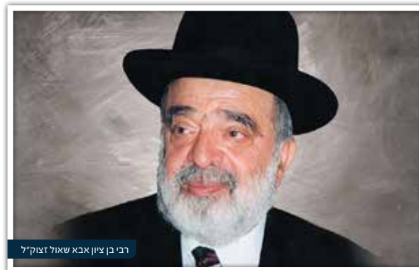
רבי בן ציון אבא שאול זצוק"ל

ומסכם הקבלן: בניתי ומכרתי מאות דירות, אם לא אלפים. ומעולם לא ארע שבא קונה ודחק בי להזכר, אולי יש איזו יתרת חוב או תוספת מחיר... (סתוך "רבינו האור לציון")