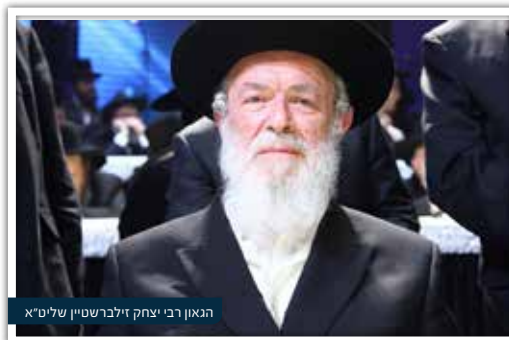
הגאון רבי יצחק זילברשטיין שליט"א