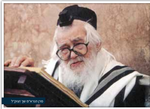
מרן הגרא"מ שך זצוק"ל

"ומדוע אתה עושה זאת?" - התעניין רבינו בסקרנות, והרופא הסביר בנחת, כפי שמסבירים למי שאינו מבין מאומה בכגון-דא: "בכל שנה, יוצא לשוק דגם חדש, ובו שיפורים ושכלולים! לכן, מאחר ואני מעוניין להנות מפסגת