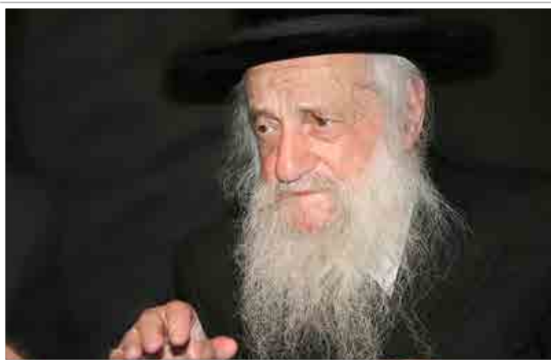
בעל 'שבט הלוי' זצ"ל

רבינו הסביר: "נכון שיש ענין שבפעם הראשונה שהילד מניח תפילין, הוא יעשה זאת על ידי רב, אבל האם חשבת, אבא יקה, כמה דברים לא טובים עלול הילד שלך לראות במהלך הדרך הארוכה שתעשה איתו מאמריקה עד לארץ ישראל? וכי הצר שווה בנזק המלך?" האב ההמום ניסה להסביר כי הילד עלול להתאכזב בצורה קשה, "שום דבר שבעולם אינו שווה שיקריבו עליו את