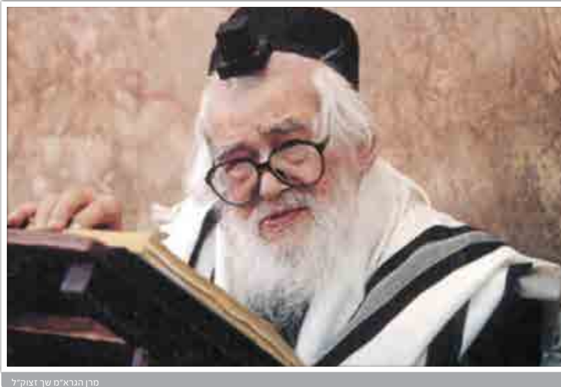
מרן הגרא"מ שך זצוק"ל

'שלוש שעות ומחצה! איזו פגישה יכולה להעסיק את רבינו זמן רב כל כך?' - תהה בליבו, אולם כמובן, לא אמר מאומה. ככל שהתארך הזמן, הצטרפו אנשים נוספים אל הממתינים. בשלב מסוים אף הופיעו שניים מחסידיו של אחד מגדולי האדמו"רים והודיעו