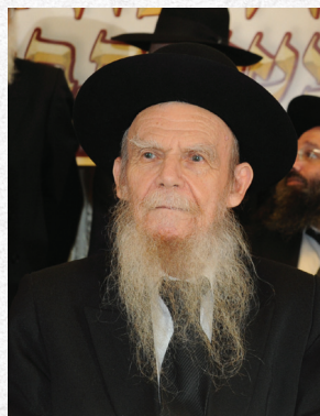
הגאון הגדול רבי גרשון אדלשטיין שליט"א

הן בתקופתנו יש מכת מדינה שסובלים מכך אברכים ובחורים, שמקבלים חלישות הדעת מתוך שנדמה להם שיש יותר מוצלחים מהם. וכמעט כולם הם דווקא המצוינים בתורה ובמידות טובות, בעלי הבנה ושכל הישה, שמתוך המידות הטובות שלהם אינן בעלי גאווה, וכיון שאין גאווה כבר אין להם את הרגשת החשיבות של בעלי גאווה, וממילא זה גורם חלישות הדעת. וזכורני שהיה בישיבה בחור אחד שסבל מאד מחלישות הדעת, ושלחו מרן הגראמ"מ זצוק"ל