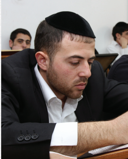
תמונת אילוסטרציה למצולם אין קשר לכתבה

הצעה ללמוד חברותא עם בחור מצוין מאד, יותר טוב מהחברותא שלומד עמו כהיום, אלא שאם יעזוב את החברותא של היום עלול הלה להיפגע מכך. והיה נראה לו מסברא פשוטה שצריך לעוזבו ללמוד עם החברותא השני, כי זה מה שהקב"ה רוצה ממנו דחייך קודמין, ואמרתיו לו כי מב' טעמים ראוי שלא לעשות כן, האי כידוע משמיי דמרנא הקה"י זצ"ל שהיה אומר שאם יש חברותא שלומדים טוב, מהיכי תיתי שיצליח גם עם החברותא השני, ואין ספק מוציא מידי ודאי. אך בלא טעם זה ג"כ ח"ו לעזוב החברותא הראשון בשביל בחור אחר טוב יותר כאשר ייפגע הראשון מכך, ואמרתיו לו שאם תעשה כן הרי יש לך לב רע, וגם עם החברותא המצוין לא תצליח, כי לא שייך להשיג הצלחה בתורה כשיש מידות רעות.