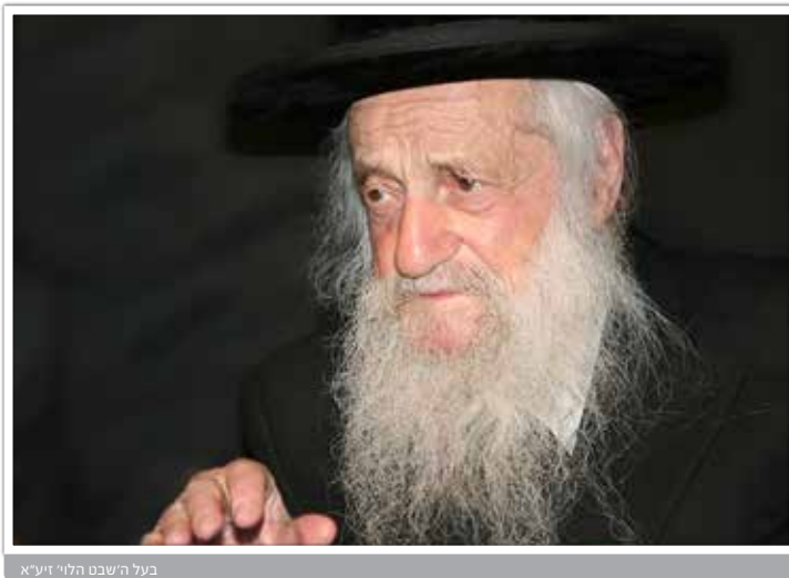
בעל השבט הלוי זיע"א

לענות לשואל ברורות היה מקפיד על הלשון כיצד לענות לשואלים. וזכורני מה שאמר בפתיחת בית ההוראה שבשכונתנו 'אור החיים' בב"ב, היה זה לפני יותר מכ"ה שנים. שצריך מורה הוראה לענות לשואל ברורות! לא להאריך עימו במו"מ של הלכה אלא לענות בחדות לשון ובקיצור אמרים: 'אסור' 'מותר'. אמנם לת"ח שהם