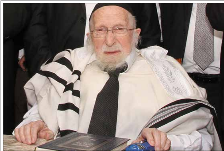
הגאון הגדול רבי חיים פנחס שיינברג זצ"ל