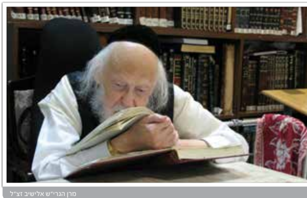
מרן הגרי"ש אלישיב זצ"ל

קינות בתשעה באב היה רבינו זיע"א מאריך באמירת הקינות, הוא היה מתחיל את הקינות בשעה שהיה רגיל להשכים קום בכל יום כדי ללמוד, שעה 2-3 לפנות בוקר, וביום זה במקום ללמוד כהרגלו, היה פותח באמירת הקינות עד שעת התפילה, לאחר קריאת התורה כשהציבור פתח באמירת 'שבת סורו מני', רבינו אמר במקום שהוא אחז, ואף על פי כן כשהציבור סיימו את אמירת הקינות רבינו עדיין לא סיים, וכשחזר לביתו המשיך לאומרם עוד זמן רב.