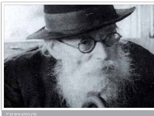
סוף החזון איש זצ"ל

תשמעו מה שה"חזון איש" הגיב: "יכול להיות שבאמת הייתי צריך