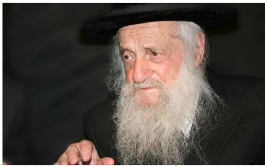
מרן בעל 'שבט הלוי' זצ"ל

"שיכנס למנוחה מיד" עד כאן לשונו, יודע עתיו ורגעיו. כך נוהג עם פטירת צדיקו וחסידיו האמיתיים. (ו) במוצאי יוה"כ, שפירשו השל"ה הקדוש ושאר ספרים הקדושים דהיינו מתוך תשובה, וכך הוא בערב שבת זמן תשובה (ז) נפטר מחולי מעיים מתמשך וכנ"ל (ח) נפטר בכניסת והתקדש ליל חג הפסח, זו בחירתו של אותו צדיק "אוהב ישראל", לצאת נשמתו בזמן שאין איש,