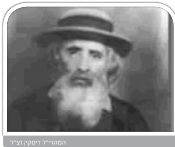
המהרי"ל דיסקין זצ"ל

טרם המשפט הגיע עורך הדין אל מקום מאסרו של הרב כדי להיפגש עמו ולתאם עמו עמדות, אך ראו איזה פלא משך כל זמן הפגישה ישב המהרי"ל דיסקין כשפניו נפולות ארצה, ולא הרים את הראש אפילו לזמן מועט, וכך כשהוא רכון על פניו ענה על שאלותיו של עורך הדין. בסיימה של הפגישה שאל עורך הדין את הרב, מדוע אינך מביט בפניי כל עת הפגישה? המהרי"ל השיב באומץ ובנחרצות: 'הרי נאמר בהלכה שאסור להסתכל בפני אדם רשע...' בהגיע עת המשפט לאחר שהוטחו כל טענות התביעה, הגיע עת הסגור לשאת את דברו ולהגן על