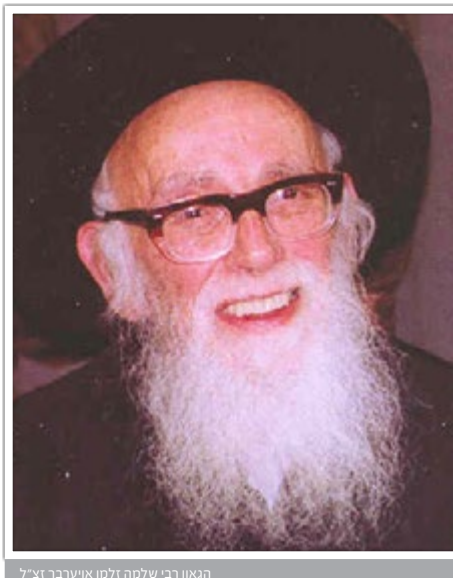
הגאון רבי שלמה זלמן אויערבך זצ"ל

נקל לתאר את מסכת התלבטותיו של היהודי הזה, שהלך כברת דרך, ונעצר, ורצה לחזור לביתו, אבל התחזק בנפשו ואמר שאם הקב"ה הבטיח