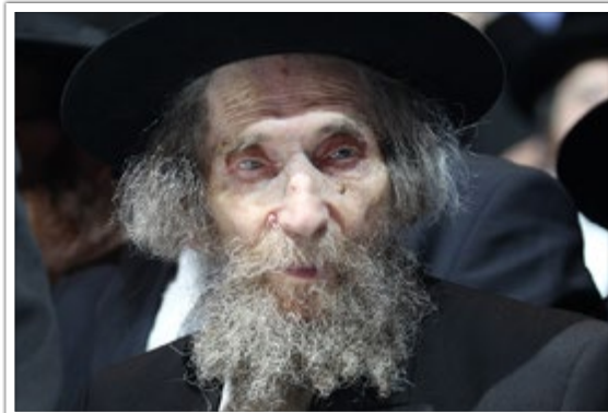
מרן הגראי"ל שטיינמן שליט"א

האווירה היתה נקיה והדבר הראשון היה יראת שמים, אבל בדורות האחרונים אם לא ילמד מהיכן יתחיל היראת שמים, הרי מיד יסטה מן הדרך כשלא יתחיל