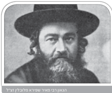
הגאון רבי מאיר שפירא מלובלין זצ"ל