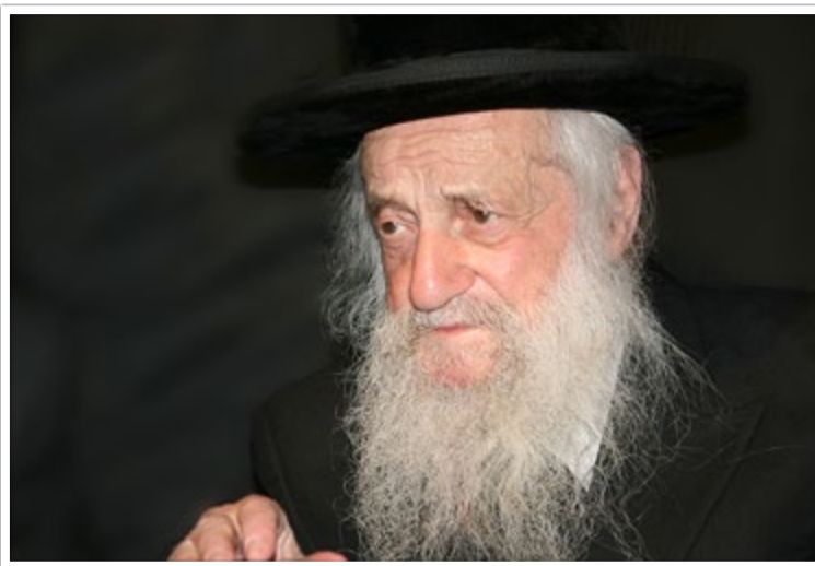
מרן בעל 'שבט הלוי' זצ"ל

לגבי כלים ומכשירים חשמליים שנקנו מגוי שאין אפשרות לטובלם מחשש לקלקולם או שקשה לטובלם. יש שנתנו עצה לתת את הכלי במתנה לגוי וכל זמן שהוא ברשות הגוי אינו צריך טבילה, ולהשאיל ממנו את הכלי בחזרה ללא הגבלת זמן ובכך יפטרו מטבילת כלים: שאלתי את רבינו לחו"ד על