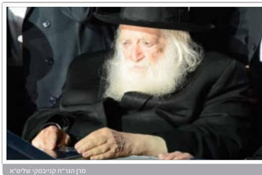
מרן הגר"ח קנייבסקי שליט"א

ובעיני ראיתי כמה פעמים שרבינו שליט"א עלה על יצועו לנוח את מנוחת הצהרים ופתאום אחר כמה דקות קם מן המיטה, וכשהפציר בו שלא הספיק לנוח אפילו רבע שעה וחשוב לבריאותו שישכב עוד מעט, אמר לו רבינו "החובות לא נותנים לי לישון", אשרי הדור שזכה שרבינו בתוכו.