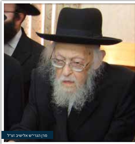
מרן הגרי"ש אלישיב זצ"ל

דורשי רשומות ופרפראות, היו דורשים בדרך צחות את דברי הגמרא, בסוגיה המפורסמת בשבת: "מאי חנוכה", וכך היו אומרים: "מאי חנוכה? דתנו רבנן! כלומה, דעיקר חג החנוכה הוא להוסיף חיילים, להתאמץ ולהתחזק בלימוד התורה".