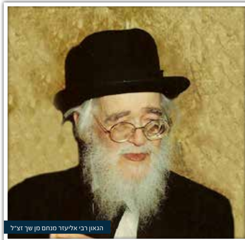
הגאון רבי אליעזר מנחם מן שך זצ"ל

כתב מרן ראש הישיבה הגאון רבי אליעזר מנחם מן שך זצ"ל, בהקדמה למהדורה החדשה לספרו 'אבי עזרי': 'מה אשיב לה' כל תגמולהי עלי, מימי צעירותי שעבר עלי זמן ועידן בחוסר כל, מה שאי אפשר לתאה מיום המלחמה הראשונה בשנת תרע"ז, שע"י גזירת המלכות נגלו כל היהודים המשך בעמוד הבא >>>