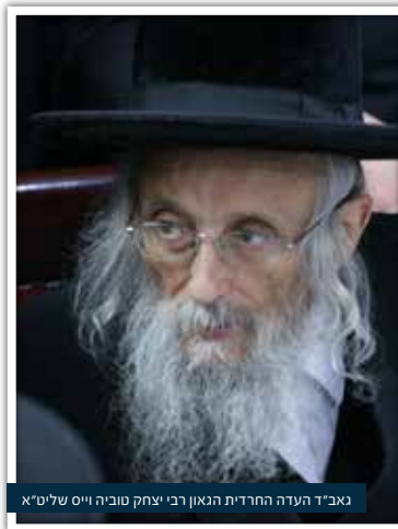
גאב"ד העדה החרדית הגאון רבי יצחק טוביה וייס שליט"א