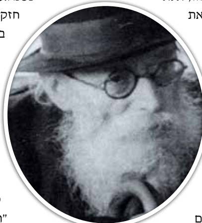
מרן החזון איש זצ"ל

תהה החזון איש: "וכי לא ראית את הציבור הגדול שהלך אחרי המכונית? אם היינו נוסעים מהר, היו מקבלים הישר על פניהם את העשן הנפלט מאחור. איך אפשר לזלזל כך ביהודים?!"