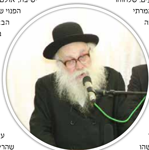
ספר הגאון רבי ניסים קרליץ שליט"א

ביום פורים אחד בא לישיבה נכדו של רבי אליהו לופיאן זצ"ל, שהיה