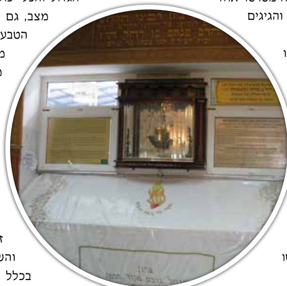
צילון רבי נחמן מברסלב צא"ל