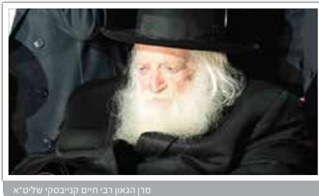
מֶרֶן הַגָּאוֹן רַבֵּי חַיִּים קֵיִיבֶסְקִי שְׁלִיט"א

ובספר חישובי חמד מביא הגאון רבי יצחק זילברשטיין שליט"א שאלה שנשאל: מעשה שהיה באבי הבת, שהתגלגל לידי כתב יד של הבחור שנפגש עם בתו, ונבהל לגלות שמדובר בבחור שאינו עושה רושם טוב כלל... אלא שכתב יד זה, נכתב לפני כשלוש שנים, וכיום הבחור עושה רושם טוב, והאב עומד ומסתפק, שמא הבחור מעמיד פנים