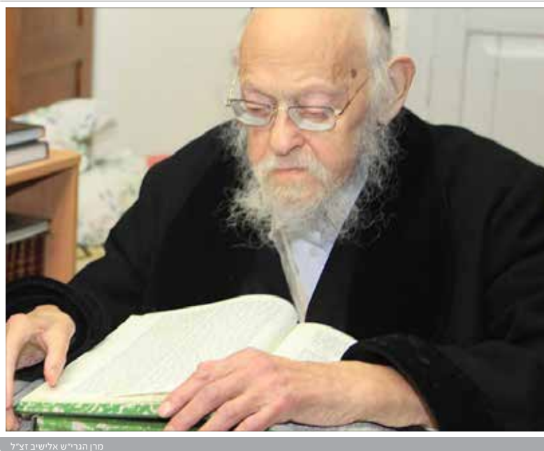
מרן הגרי"ש אלישיב זצ"ל

הגאון רבי יצחק זילברשטיין שליט"א בעריכת הרב משה מיכאל צורן)