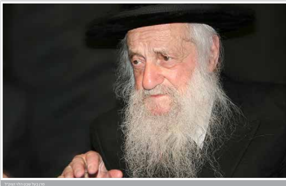
מרן בעל שבט הלוי זצוק"ל