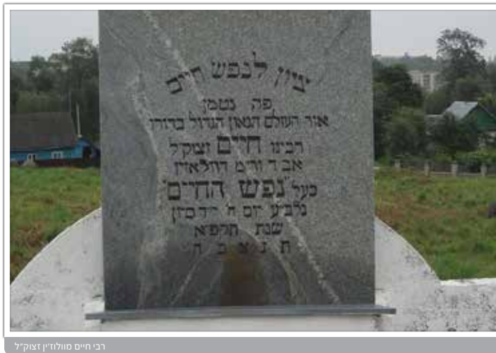
רבי חיים מוולוז'ין זצוק"ל

כעבור תקופה לא ארוכה, אומר ר' חיים לרעבעצין: "סעי לאותה אלמנה, ותאמרי לה כי אנו מעוניינים מאד בשידוך הזה. ואם היא תסכים – את יכולה 'לגמור' את השידוך גם בלעדי". הרבנית, אשה כשרה העושה רצון