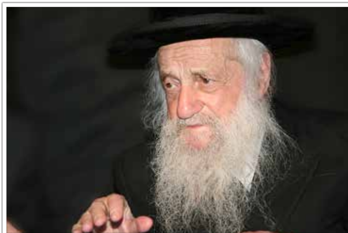
מרן בעל 'שבט הלוי' זצוק"ל

התשובה היא, שכל מורה הוראה ודיין צריך לידע שהוא צריך לשתף את ליבו ורגשות ליבו לשואלים. מגיעים הרבה פעמים שואלים המייחלים ל"ווארימקייט" לחמימות, ול'גוט ווארט', ולמילה טובה, ומגיעים בברכיים כושלות, ועלינו מוטלת החובה לחזק את ידם הרפה, ולאמץ ברכיהם הכושלות. להפיח רוח חיים בלב כל אחד מהשואלים, וזהו 'ולהורות נתן בליבו', וזה צריך להיות דברים שבלב ולא מספיק כשזה מן השפה ולחוץ, וצריך שיהיה פיו וליבו שווים,