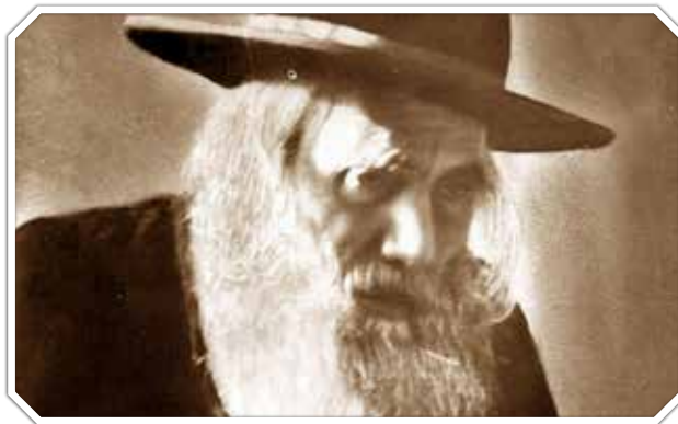
ר' יוסף חיים זוננפלד