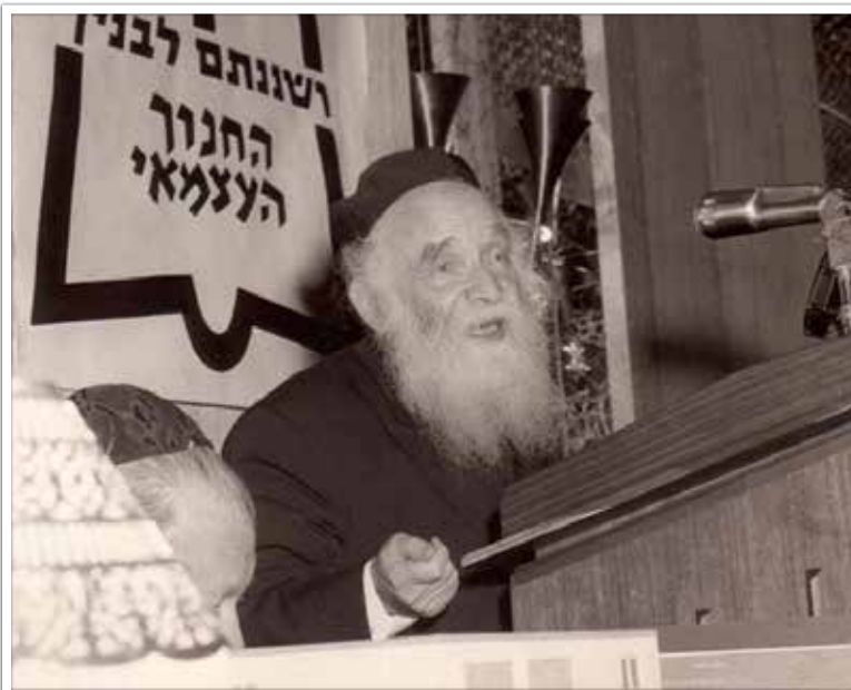
הנאון רבי אהרן קוטלר זצ"ל

אי אפשר להעריך ולאמוד את התועלת העצומה שהגיעה על ידי ישיבה זו לעולם התורה והיהדות! וכל זאת – לזכותו יחשב! מה היה קורה בלעדיו? האם הייתה הישיבה המפורקת באותה תקופה מעורערת מסוגלת להיבנות מחדש? אף בהתחשב בנחישותו ובכוחותיו של רבי אהרן קוטלר זצ"ל, אין ספק כי