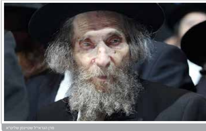
מרן הגראי"ל שטיינמן שליט"א

שקרנים עפ"י רוב ממשיכים בדרכם. שקרן לא משקר פעם אחת, אלא הרבה. ובנוסף, הוא גם בטוח שהוא בסדר, אומה: שיקרתי קצת... והחזו"א אומה: אדם מפחד, כי יודע שאח"כ יתברר שמה שאמר לא אמיתי, אבל מי שיודע שהאמת תמיד איתו - לא מפחד. (מזקנים (אתבונן))